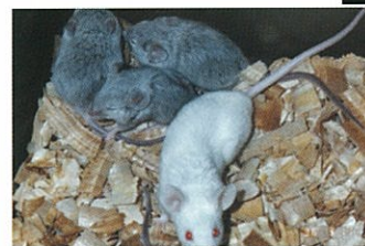
遺伝子を破壊したノックアウトマウス