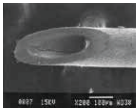
チタン製マイクロニードルの試作品 SEM