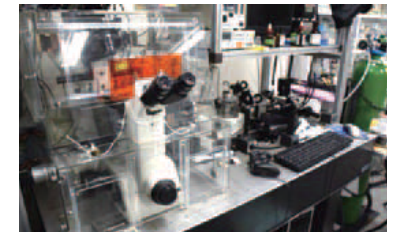
レーザー光を用いて物質を局所的に制御する装置

私たちは外から食べ物を摂取してエネルギーを消費しています。また、血液や酸素は絶え間なく体内を循環して止まることはありません。つまり、非平衡の環境の中で私たちは生きているのです。「この非平衡特有の揺らぎ現象から、生物に似たものを作り出せないかと考えています」と貞包助教。その一つが、レーザー光を使った微小相分離液滴のパター