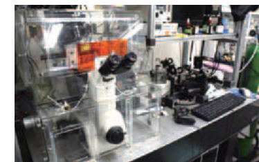
レーザー光を用いて物質を局所的に制御する装置

私たちは外から食べ物を摂取してエネルギーを消費しています。また、血液や酸素は絶え間なく体内を循環して止まることはありません。つまり、非平衡の環境の中で私たちは生きているのです。「この非平衡特有の揺らぎ現象から、生物に似たものを作り出せないかと考えています」と貞包助教。その一つが、レーザー光を使った微小相分離液滴のパター